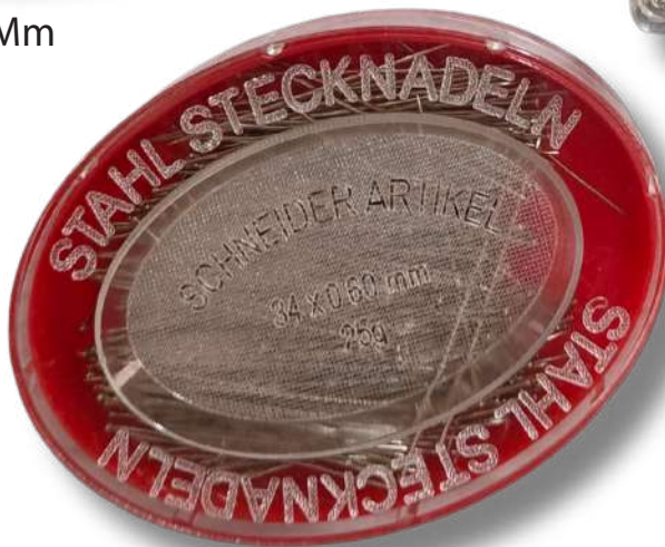
Alfiler 34x0.60 Mm Versátil Cajas De 20 Unidades