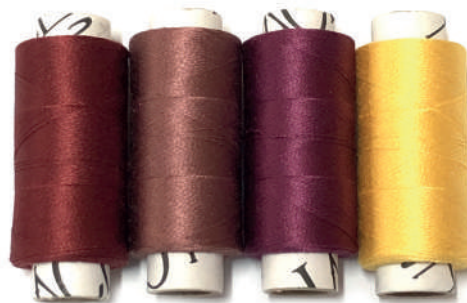
BORGOÑA PALO ROSA MORA AMARILLO

ESPECIAL ABANICOS, PAÑUELOS, LIGAS, BORDADO EN TUL