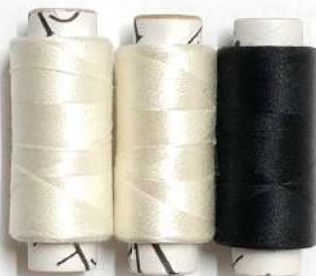
BLANCO CRUDO NEGRO