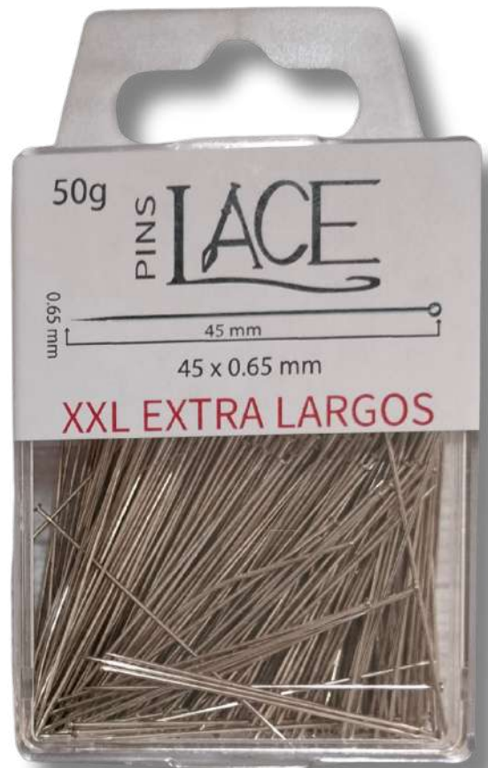
Alfiler 45x0.65mm Extra Largo Y Fino Cajas De 5 Unidades