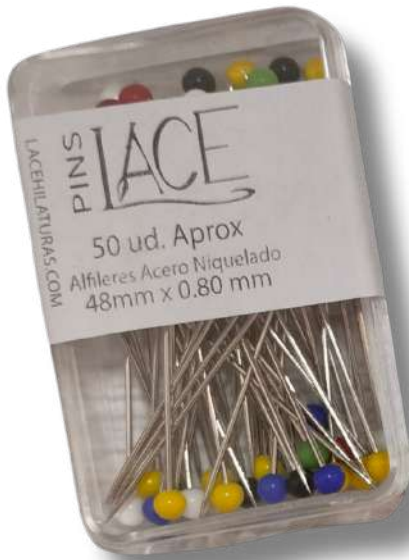
Alfiler 48 X 0.80 Mm Separador Cajas De 10