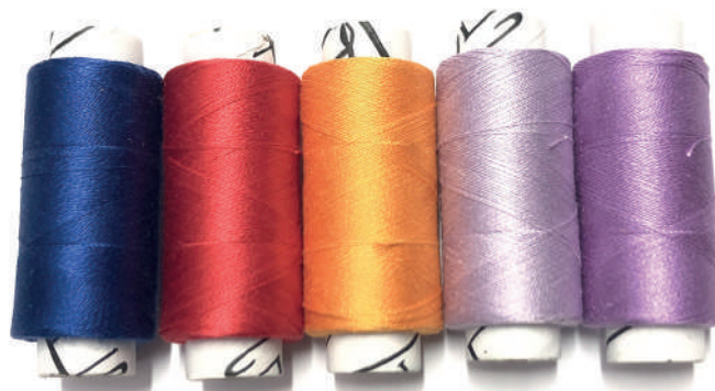
ROYAL ROJO PASIÓN NARANJA VIOLETA CLARO MALVA